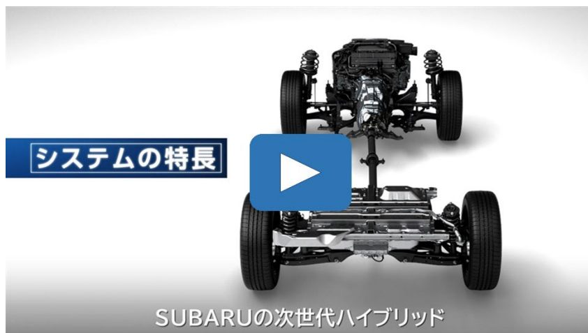
SUBARU ストロングハイブリッド 技術説明動画