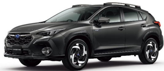
クロストレック ストロングハイブリッド搭載モデル (日本市場向けプロトタイプ)

今回発表した「ストロングハイブリッド」は、走りの愉しさと環境性能を高い次元で両立させた、SUBARU として新たに開発した次世代のハイブリッドシステムです。